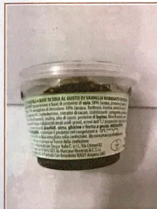
Inserire immagine due: