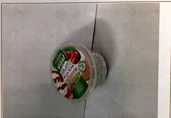
Inserire immagine uno:

AVVISO RIVOLTO AI CONSUMATORI CHE HANNO ACQUISTATO IL PRODOTTO, CHE SONO INVITATI A NON CONSUMARLO E A RIPORTARLO PRESSO IL PUNTO VENDITA